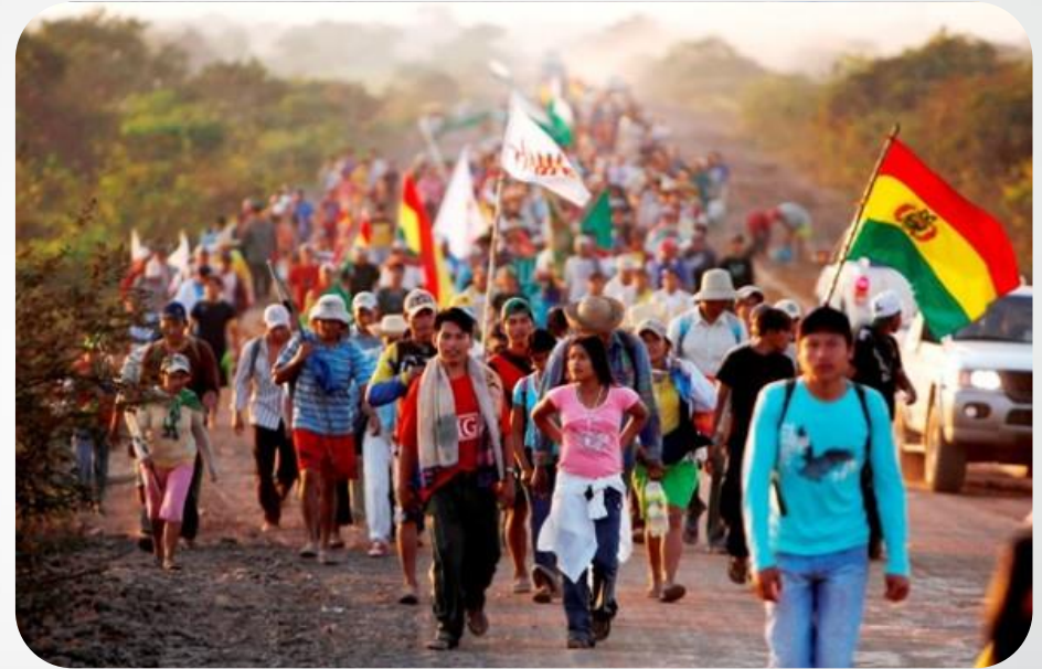
Marcha por la dignidad, tierra y territorio de los pueblos indígenas de tierras bajas (marcha por la vida 1990)