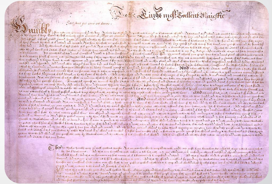
En 1628 el Parlamento Inglés envió esta declaración de libertades civiles al Rey Carlos I.