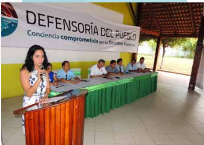
EN COBIJA CON INSTITUCIONES ALIADAS