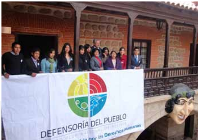
LA DEFENSORÍA EN LA CASA DE LA MONEDA

En las 18 oficinas defensoriales del país se realizaron eventos de presentación de la nueva etapa institucional. En los eventos participaron autoridades nacionales y locales, entidades de defensa de los derechos humanos, organizaciones sociales, poblaciones con derechos vulnerables, medios de comunicación y ciudadanía. Las servidoras y servidores públicos de la Defensoría, así como la ciudadanía recibieron una explicación completa sobre el alcance, los objetivos y la nueva visión institucional.