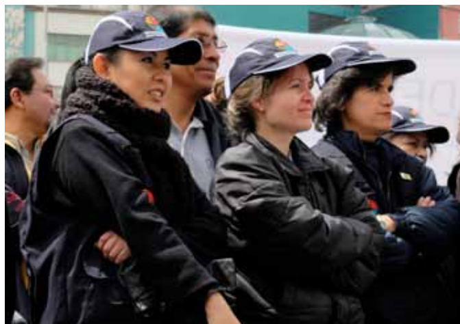
LAS SERVIDORAS PARTICIPAN EN LA FERIA DEL RELANZAMIENTO EN LA CIUDAD DE LA PAZ