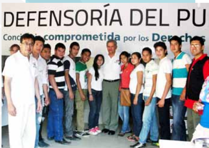
CON VOLUNTARIOS EN TRINIDAD