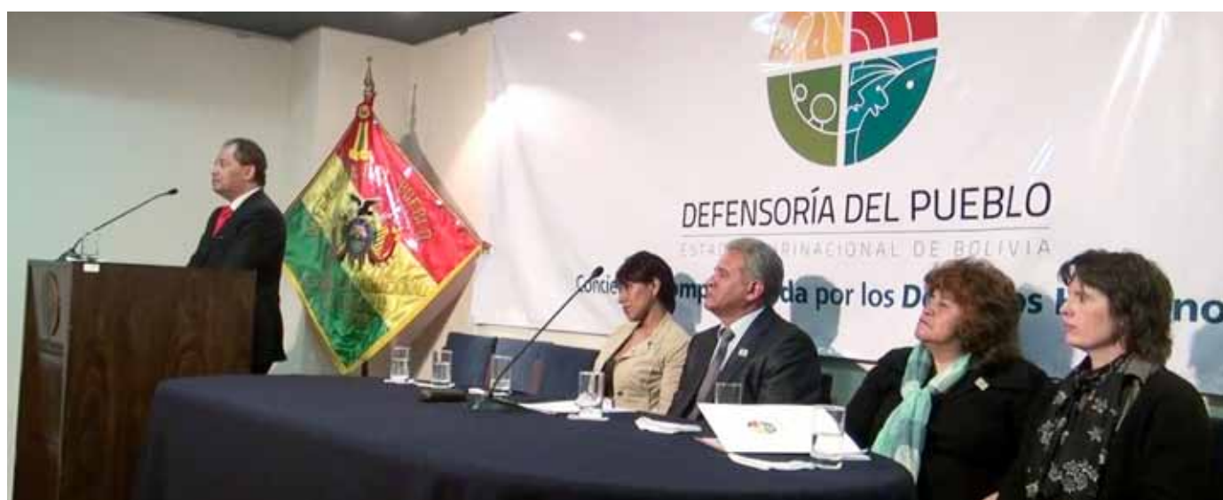
La Paz. Representantes del Órgano Ejecutivo y de la Cooperación Internacional, participan en el acto de relanzamiento de la Defensoría del Pueblo

fue complementada con reuniones con las servidoras y servidores de la institución a quienes el Defensor explicó en detalle las nuevas visiones, enfoques de trabajo y objetivos de la Defensoría del Pueblo en esta nueva etapa institucional.