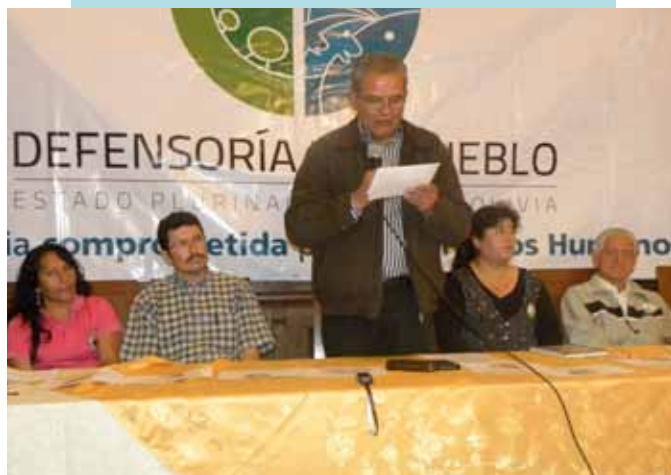
PRESENTACIÓN EN LA CIUDAD DE TARIJA