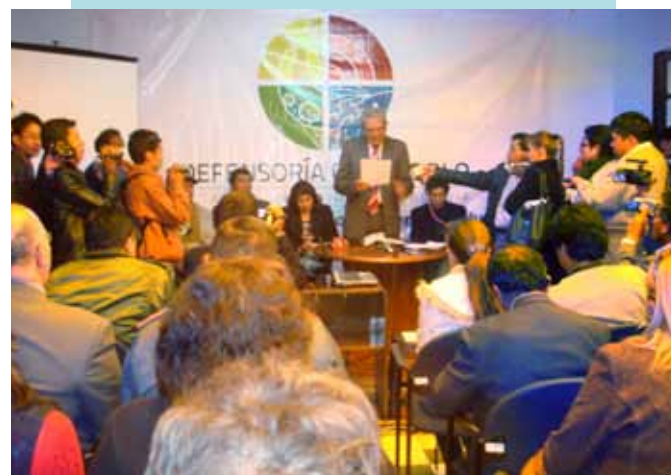
MASIVA PARTICIPACIÓN EN OROURO